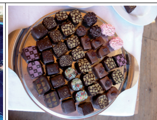
Belgické lanýže, no mňamózní záležitost