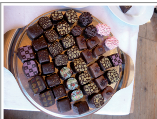
Belgické lanýže, no mňamózní záležitost