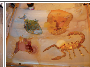
Moje Mandala :)